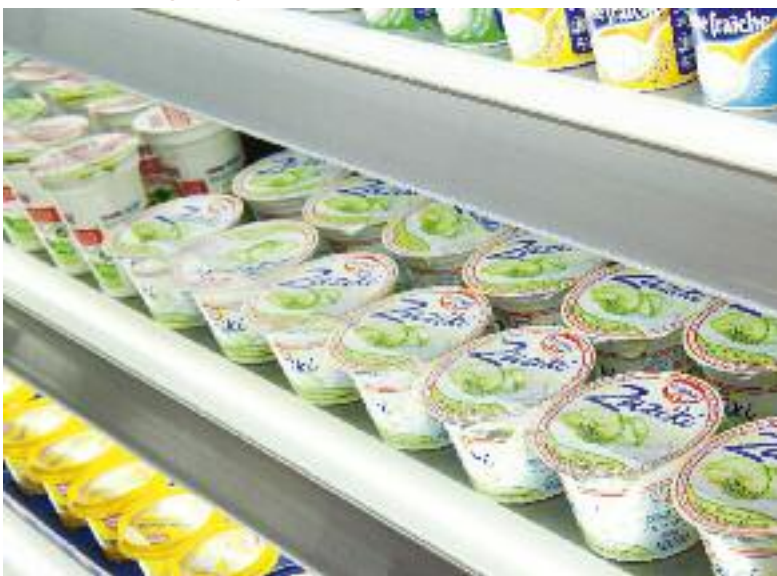
Eclairage d'étagères avec tubes T5 LED

Vous avez le choix entre différentes couleurs de lumière selon le type de produit. Chaque lampe fluorescente est protégée de l'humidité, des détériorations et de la saleté par un tube de protection en polycarbonate.