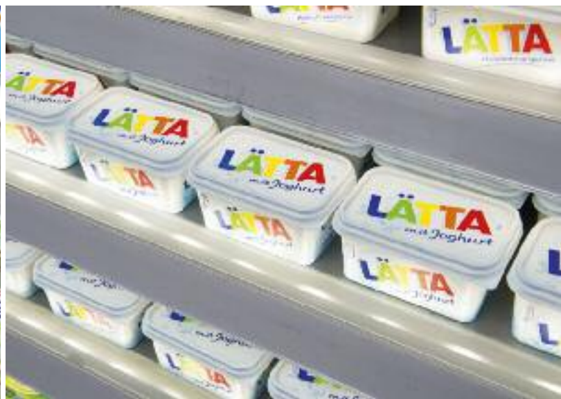
Modules à LED

PAN-DUR vous offre une présentation idéale des produits grâce à un positionnement intelligent des éclairages.