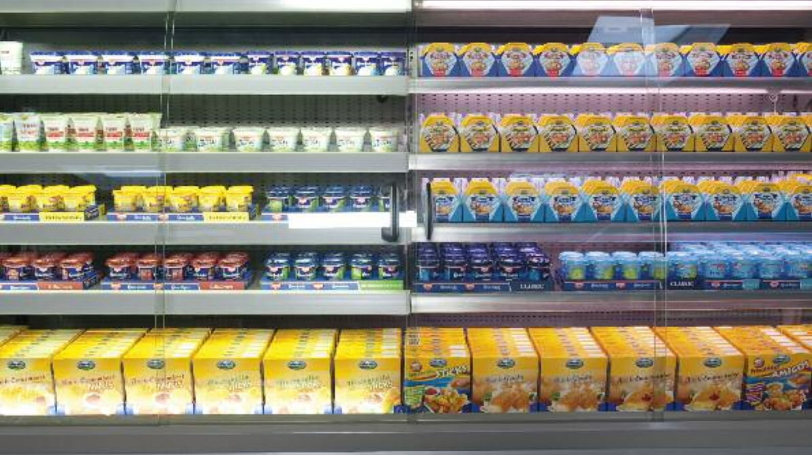
ECO SEMI S avec éclairage d'étagères haut et bas