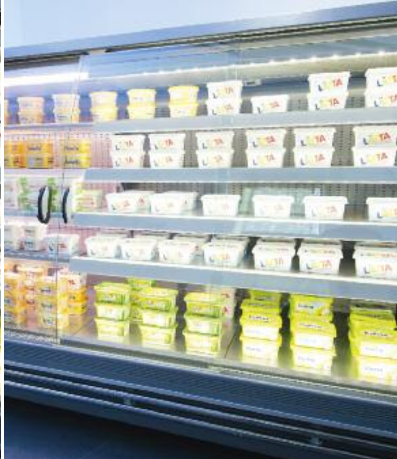
ECO SEMI D